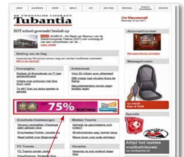
Full banner 468 x 60 pixels Max. 50 kB

*Contractkorting is hierop niet van toepassing.